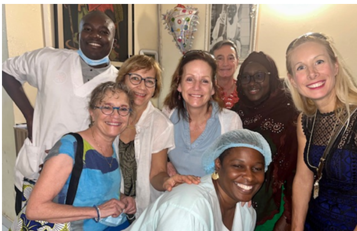
Photo prise lors du congrès de SP de la SOSECAN, ASSOPA et FFISP à Dakar au Sénégal.