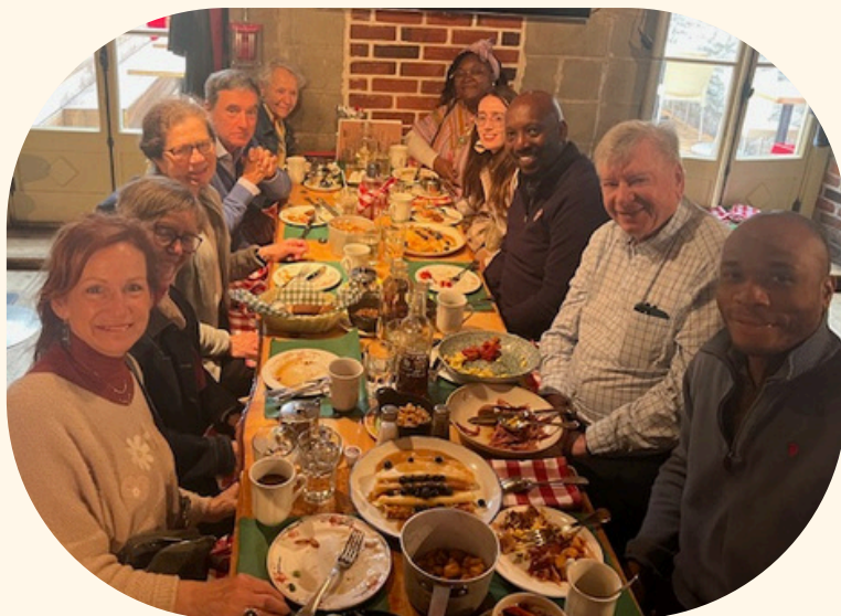
Brunch au restaurant La Bûche organisé en l'honneur des invités du congrès 2025 provenant de l'international.